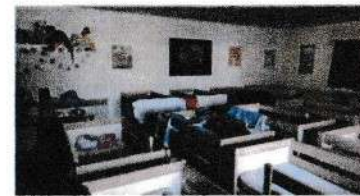
École Basly - Sallaumines - circonscription d'Avion