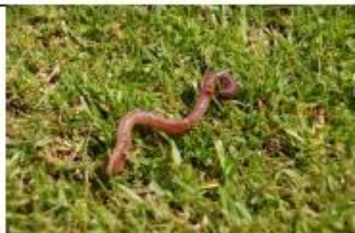
VERT DE TERRE